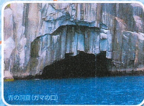
青の洞窟(ガマの口)

コースの人気スポットで別名「ガマの口」とも呼ばれています。太陽光線によって海の色が変化し、周囲に比べ、より鮮やかなエメラルドグリーンの澄んだ海面が見どころです。遊覧船からしか見ることができない絶景で、波が穏やかな時は洞窟の中まで入ることができます。